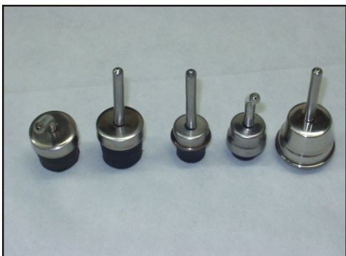
Ilustração de diferentes montagens de bicos e bebedouros completos.

Podendo ser retos, curvados a 45° ou 90°. Outras medidas sob consulta.